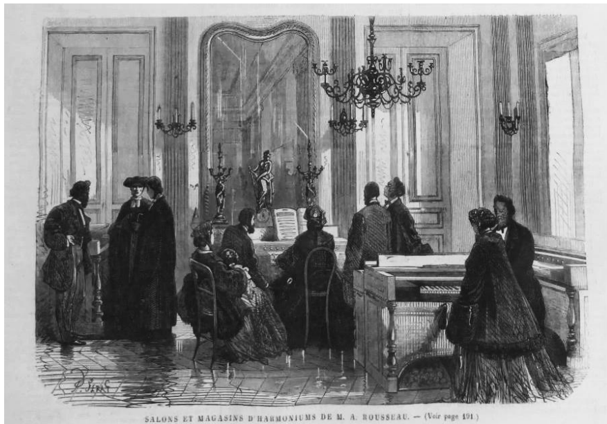
Atelier van harmoniumbouwer Alexandre Rousseau (uit: Le Journal Illustré ).

Meer kleurrijke of ongewone klankcombinaties (of registraties waarbij de bas en discant verschillend geregistreerd zijn) worden niet verder toegelicht; Rousseau heeft zich hier beperkt tot de “ensemble”-klanken.